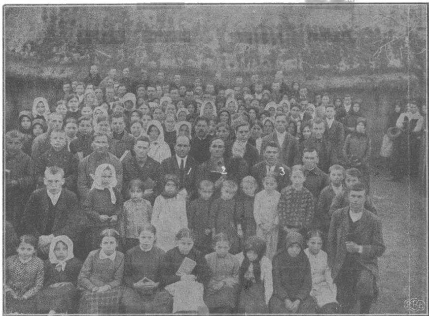
Громада віруючих в Гійчу (Галичина).

„То йди за мною, ти, впертий мурина”, сказав властитель пан, тремтячи від гніву, побачимо, кого треба слухати.”