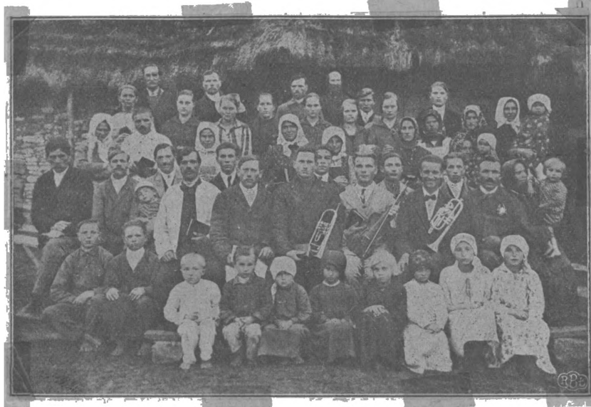
Збір Християн-Баптистів в Вальдорфі, Галичина.

Але почались переслідування зі сторони державного уряду, які спричинювали попи, боялись втрати своїх легких доходів, та введеного авторитету. Було справді їм легко євангеликів переслідувати, бо вони були позоставлені без