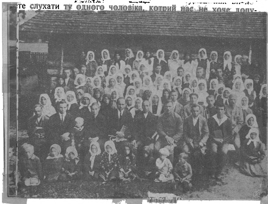
Збір Християн-Баптистів в Забірю. Галичина.

те слухати ту одного чоловіка, котрий нас не хоче попу-