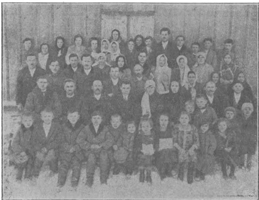
36 р християн Баптистів в Войткові, Галичина.

Громадка віруючих часто сходилась до бр. Ф. М. на спільні збори, де утверджувались у слові Божім та в однодушних молитвах як перві христіяне. (Д. Ап. 1, 13-14). Так вони зростали в благодати й упізнанню Господа нашого і Спаса Ісуса Христа. (2 Петра 3, 18).