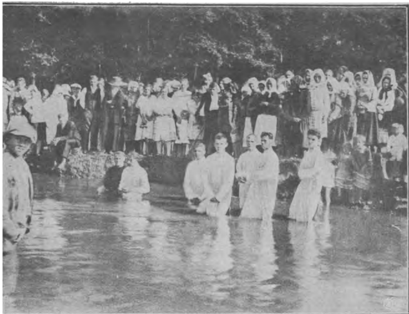
Хрещення в Раві Руській

Я бажаю поділитись з вами, дорогі у Христі брати і сестри, цюю радістю, котру ми мали в неділю 18 серпня ц. р. Радувались ми тому, що під відкритим небом і перед сотками людей 6 братів і 4 сестри вступили в завіт з Господом Ісусом Христом. На цю урочистість були запросими мене равські брати і сестри.