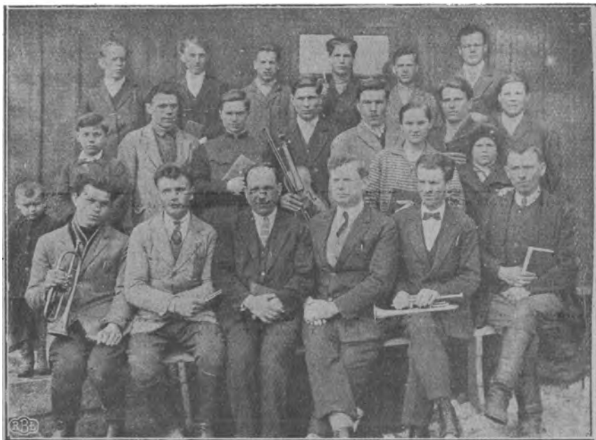
Біблійні курси в Рави Руской

котрі своє життя віддали для Него. Мусимо признати, що світ цей має дуже багато своїх проповідників, але щирих і правдивих проповідників стрічаємо дуже мало, котріб служили Христові не ради визиску, але ради спасення погибших і піднесення бідну людину до щасливішого життя. Євангелія — це є добра новина від Господа для упавшого людства.