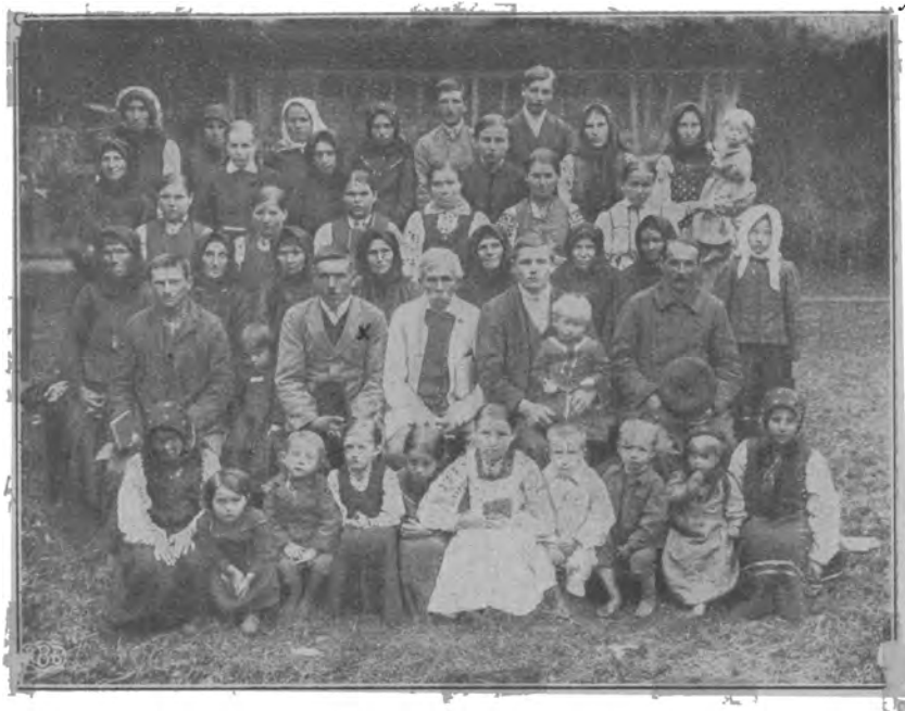
Збір християн Баптистів в Куляві, Галичина.

Над могилою розпочав зібрання бр. М. К., котрий прочитав слово Боже з посл. до Гал. 6, 7 і говорив на тему: „Що бо чоловік сіє, те й жати ме.” По короткій промові