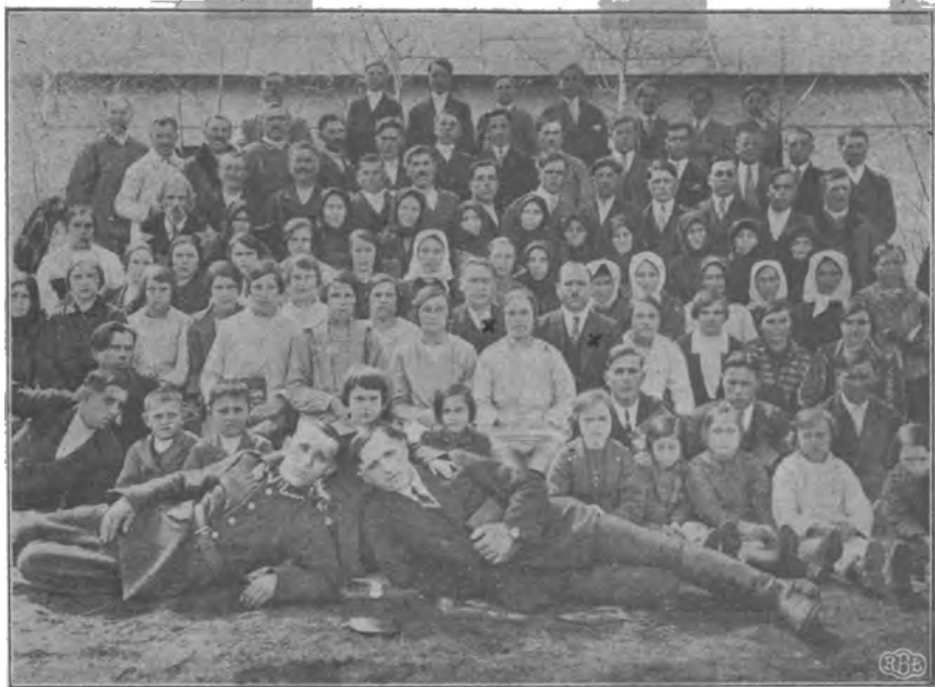
Громада Хр. Б. в Озерянці.

Подумайте глибоко о цім ділі, і кому дорогий Христос